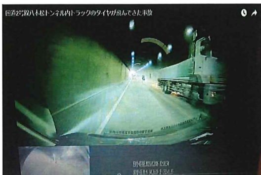
大型トラックの左後輪タイヤ2本が外れるとともに、車軸が路面に接地し火花が発生