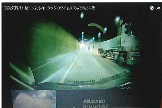
大型トラックの左後輪タイヤ2本が外れるとともに、車軸が路面に接地し火花が発生