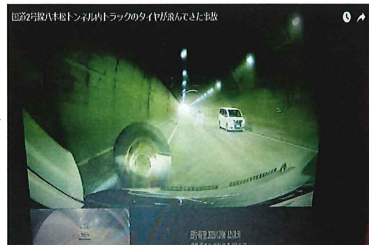
外れたタイヤ2本が弾みながら、対向車に衝突し停止