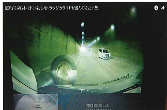
外れたタイヤ2本が弾みながら、対向車に衝突し停止