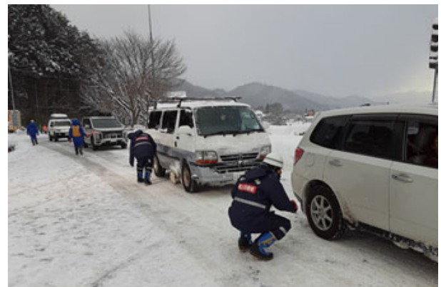
タイヤチェックの状況(R4年1月1日:R17猿ヶ京除雪ステーション)