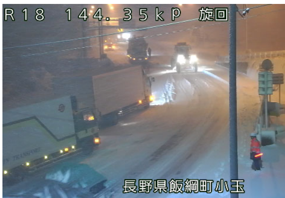
スタック車両の発生状況(R3年12月17日:R18 飯綱町内)