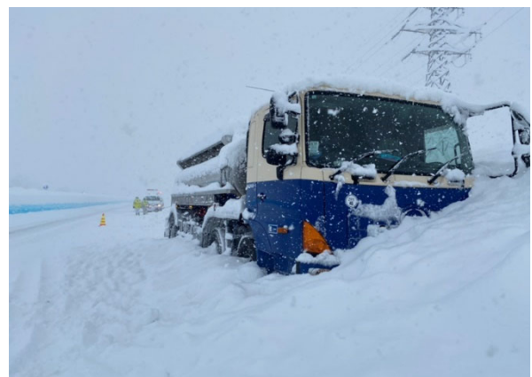
スタック車両の牽引状況(R3年12月17日:国道18号飯綱町)