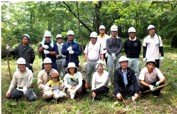
★支部内参加者は幾つかの班に分けられた。左は終了時の2班の集合写真。