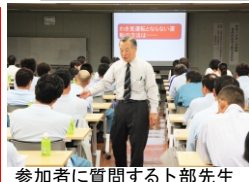
参加者に質問するト部先生

◆群馬県内の交通事故発生状況をH21年とH22年の比較で説明。主要な事故原因となる、①脇見運転②横断歩行者妨害③一時停止場所の通過の3点を詳しく説明された。