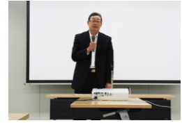
金沢頭社長挨拶での