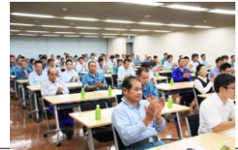
講習会参加の皆さん