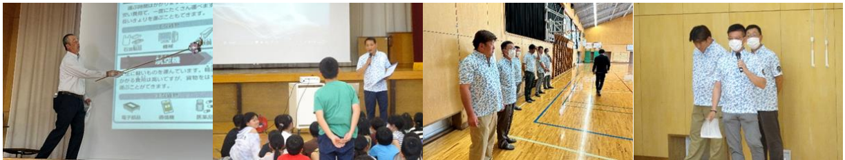
【前橋市立新田小学校】